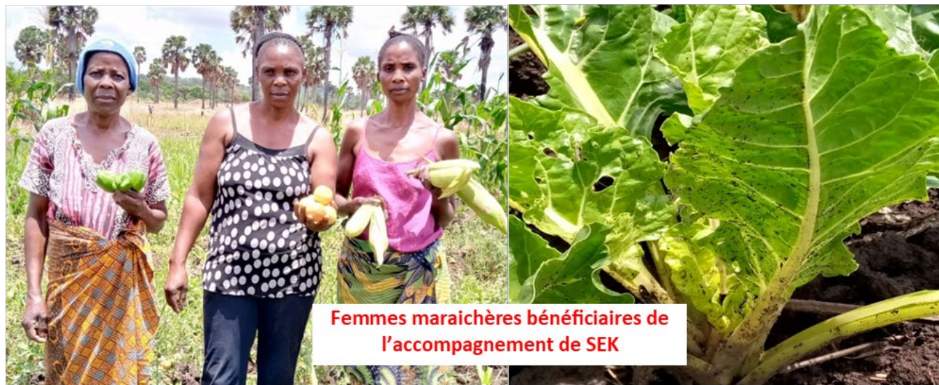
Femmes maraîchères bénéficiaires de l'accompagnement de SEK

du village Katanga qui continue à produire ainsi qu'à vendre ses produits à SEK, celles d'autres villages (Kangambwa, Luafi et Lukutwe) ne sont plus opérationnelles. Le manque d'organisation, de transparence et d'un bon leadership en sont les causes principales. D'après les femmes du village Lukutwe, les gestionnaires de l'association ne rendaient pas compte de la gestion des fonds aux autres membres. Le manque de transparence et la mauvaise répartition des bénéfices sont autant de problèmes qui ont découragé les autres membres, jusqu'à paralyser complètement l'association. 55