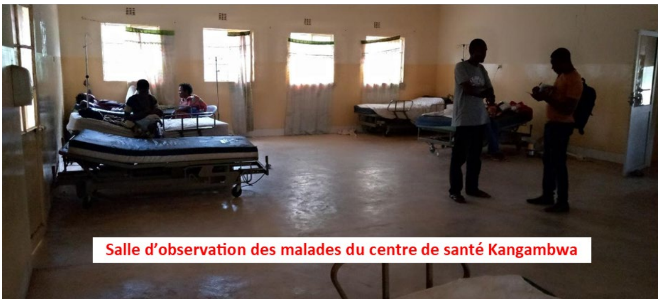
Salle d'observation des malades du centre de santé Kangambwa