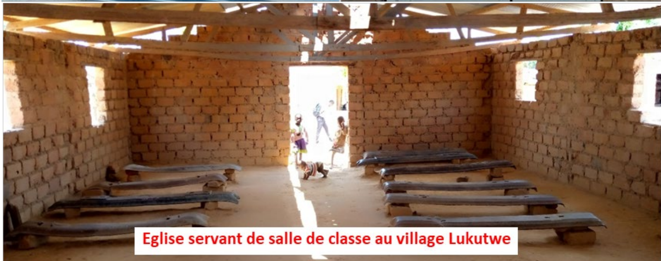
Eglise servant de salle de classe au village Lukutwe