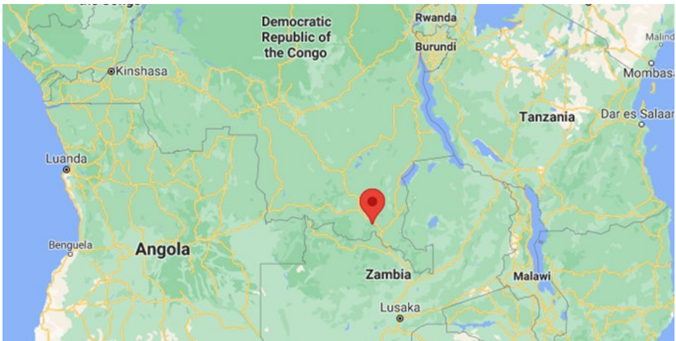
Carte indiquant l'emplacement de la mine de cuivre de Kipoi, coordonnées 11°12'52"S 27°03'26"E.

Cela est surprenant en plus en raison du fait que SEK a bénéficié en 2015 d'un investissement de la Société Financière Internationale, dont les normes de performance (NP ou PS) exigent la considération des impacts sur les populations locales, par exemple, "La diminution ou la dégradation des ressources naturelles, qui peut avoir notamment des effets négatifs sur la qualité, la quantité et la disponibilité d'eau potable" (NP 4, para. 8).